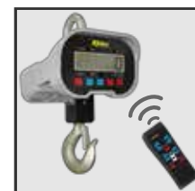
Opción de operación a distancia por control remoto

SERVICIO Y REFACCIONES DISPONIBLES Contamos con una red de centros de servicio en toda la república: rhino.mx/servicio.html