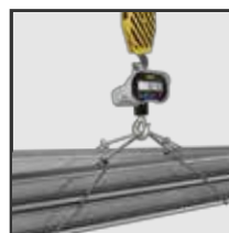
Ideales para la industria, construidas en acero