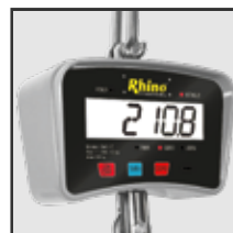
Pantalla de cuarzo líquido con iluminación